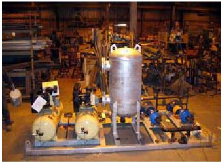
Tubo TDA con compresores y bomba de saturación montada sobre chasis

El tubo dilutor de aire de Workindus para producir el agua súper saturada, esta opera a una presión de 74 Psi con una eficacia de aire disuelto de más del 80%. Por cualquiera de los métodos mencionados se producen micro burbujas con un tamaño en el rango de 10 a 50 micrones en números de REINOLS el cual reduce la relación de reciclaje.