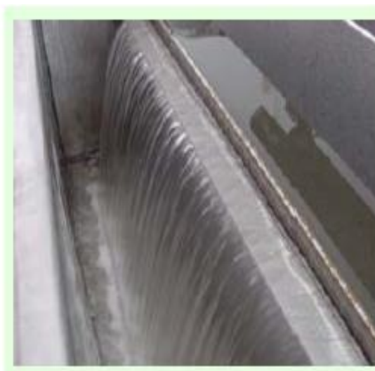
Efluente a la salida del sistema de clarificación por aire disuelto DAF