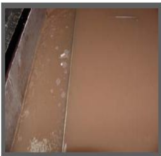
Influente antes de ser sometido al sistema de purificación por aire disuelto

El RCS promedio de diseño es de (8 kg / m 2 * hr) hasta (18 kg / m 2 * hr)